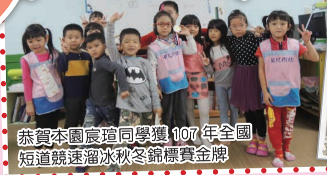
恭賀本園宸瑄同學獲107年全國短道競速溜冰秋冬錦標賽金牌