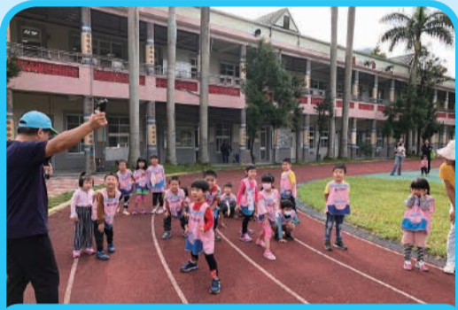
3. 由校長鳴槍預備跑