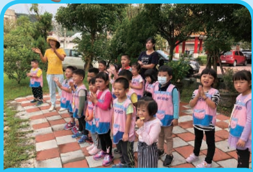
1. 先擔任可愛加油團