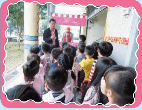
1. 我會排隊跟老闆點餐喔!