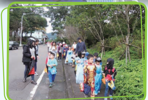
向下一站出發中~ 謝謝志工家長鼎力相助。