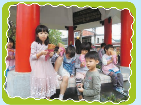
4. 難忘的可麗餅體驗活動