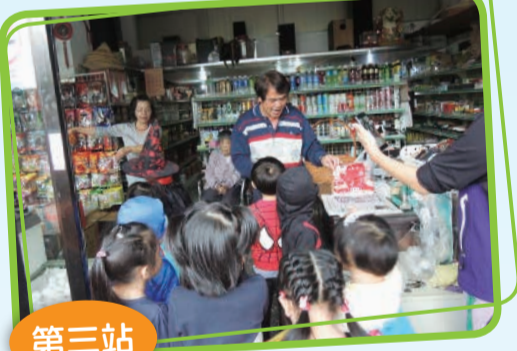
導護商店 - 常菁商店