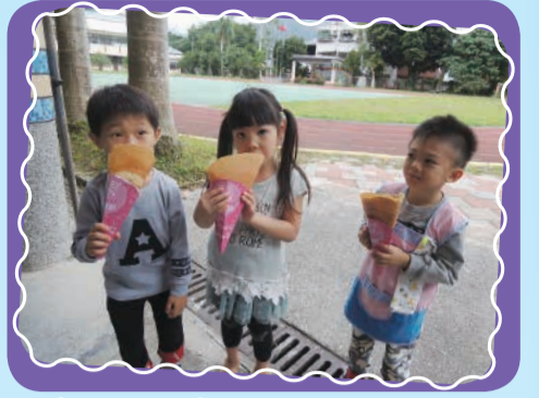
2. 拿到自己喜愛的可麗餅很開心!