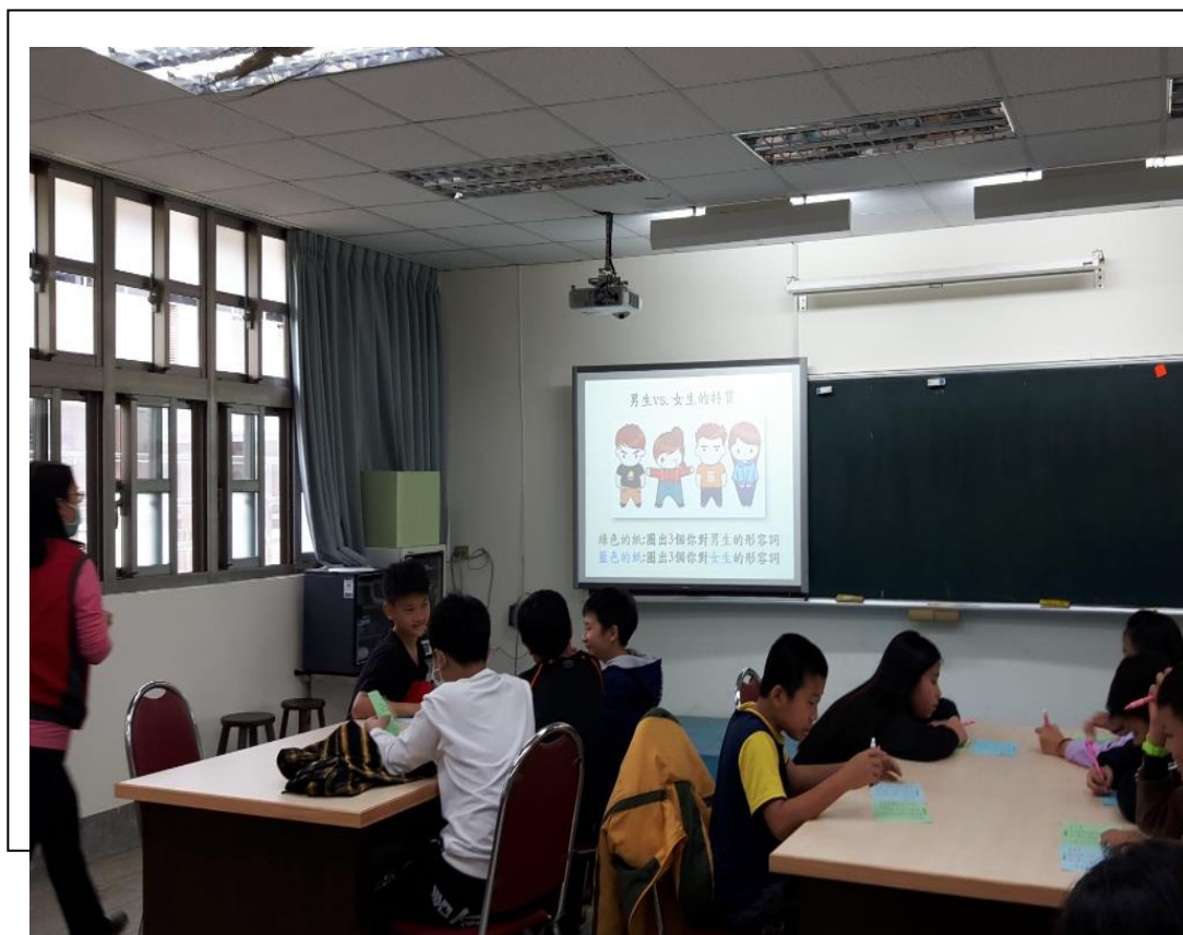
我適合談戀愛嗎? 1.引導學生願意更加認識自己 2.如何增加自己的EQ