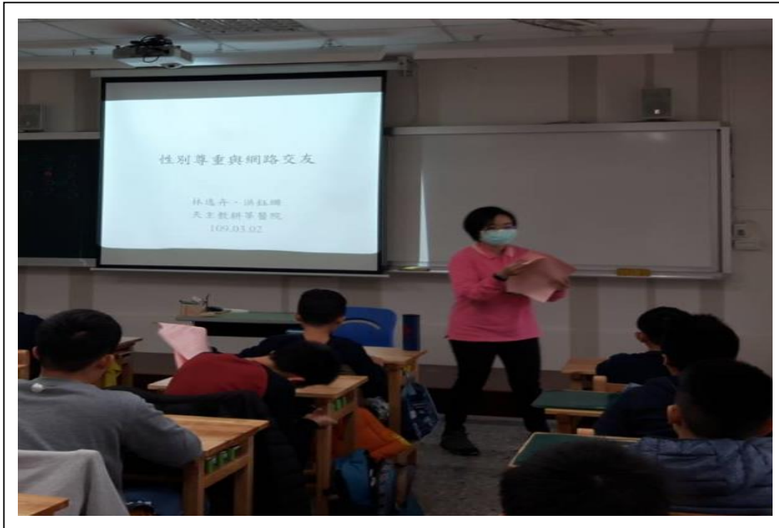
有色眼鏡(1.網路交友安全 2.歧視言語)