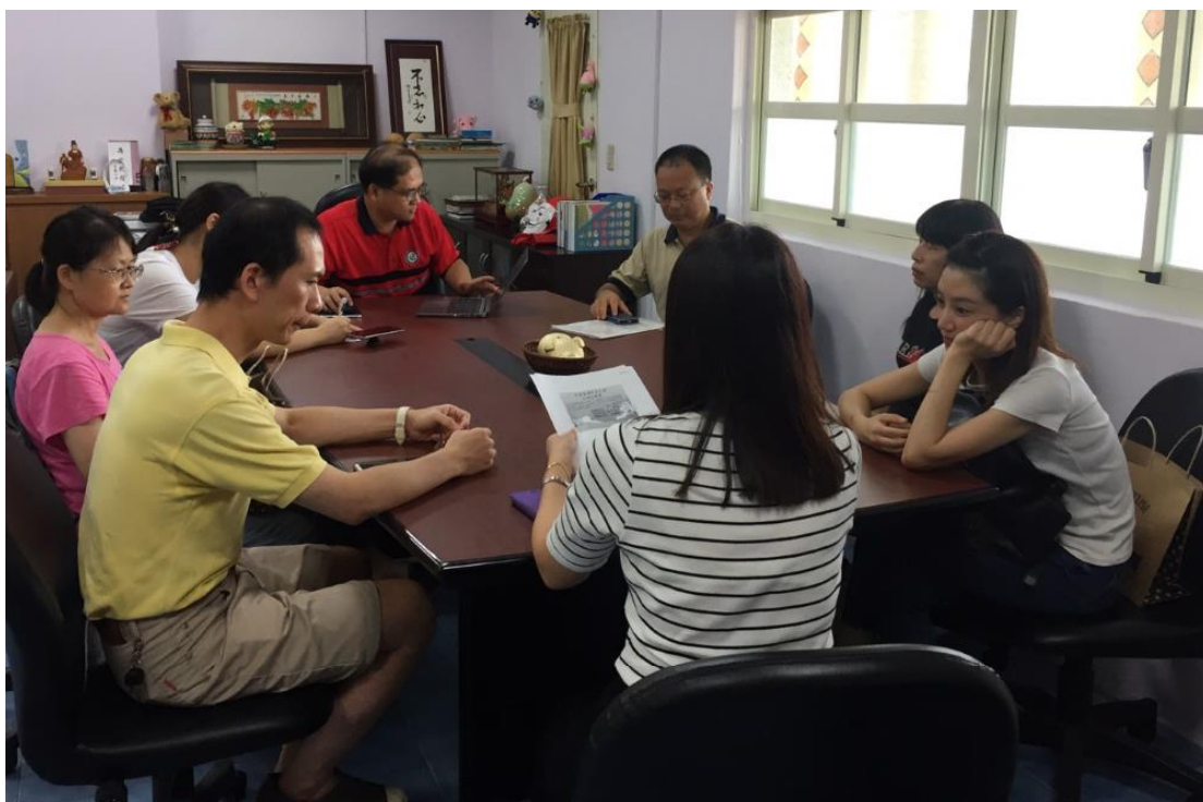
辦理 108 學年度新生家長親職教育講座。