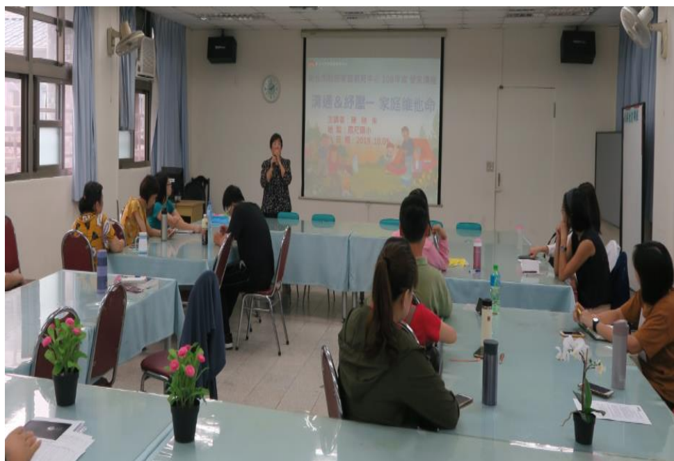
辦理 108 學年度家庭教育中心講座，宣導家庭教養情緒管理。