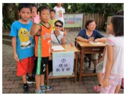
▲ 闖關活動-環保教育觀