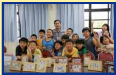
▲ 「尚自然馬賽克」課程