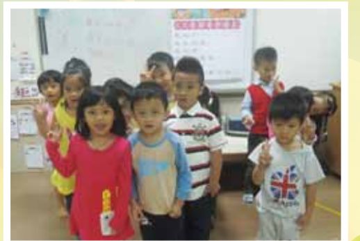
排好隊準備出發由小組長帶去參加男生和女生主題闖關活動