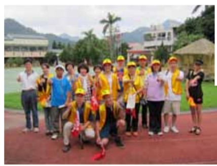
▲ 志工們在活動前合影