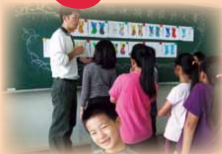
▲ 貓咪換裝票選時間