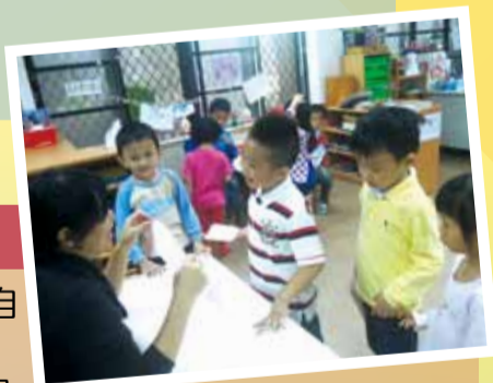
我很厲害喔！闖關遊戲難不倒我們！！