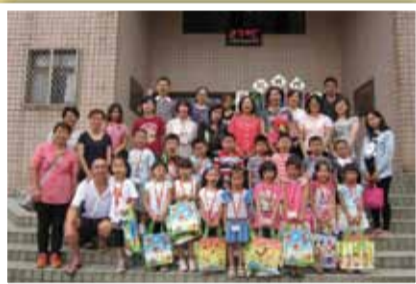
新生入學典禮後合照