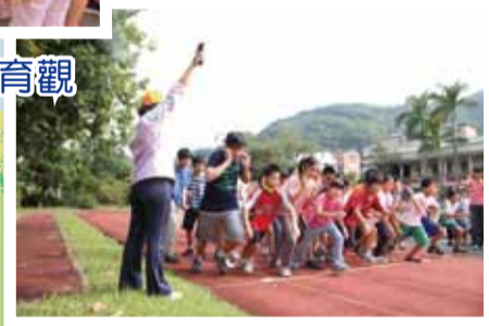
▲ 校長鳴槍,選手們即將起跑