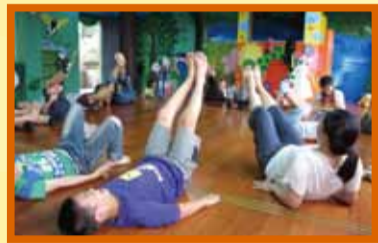
▲ 藝術與人文教學 深耕活動