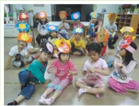
動物面具大集合！ 我們很酷吧~~