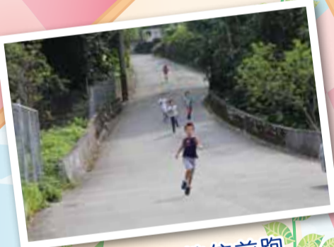
▲ 學生們努力地往前跑

今天早上08:20集合，我們排好隊去操場，然後在做操，做完操以後，還介紹義工媽媽和義工爸爸，介紹完以後，我們要準備起跑了。先由我們高年級跑，從屈尺跑到濛濛谷，我很努力的跑。在路途中，我看到明峰老師在拿著照相機拍我們大家，後來我終於跑到終點站了，我跑到汗流浹背，最後，我跑回屈尺之後，就要闖關活動了，我就很开心。加油！