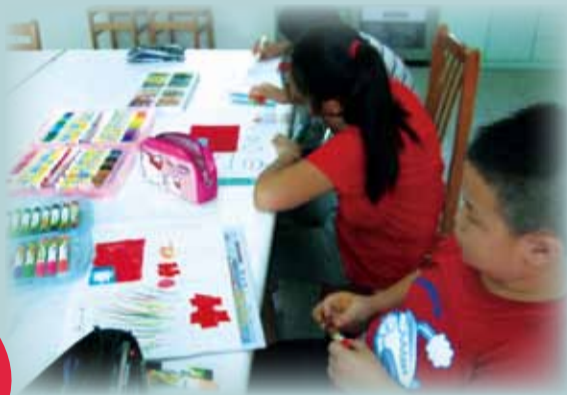
▲ 學生認真畫圖的模樣